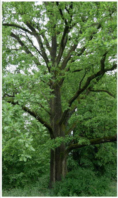
Zentraler Punkt des Gartens der Religionen wird diese alte Eiche.

„Kein Weltfrieden ohne Frieden zwischen den Religionen“, so der katholischen Theologe Hans Küng. Dies ist Motivation für die interreligiösen Projekte des Pilgerzentrums Reinhardsbrunn im Klosterpark. Neben der Mitwirkung bei interreligiösen Pilgerwegen laufen dort seit einiger Zeit die Vorbereitungen für einen Garten der Religionen.